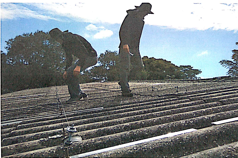
Instalação das hastes de fixação dos painéis solares