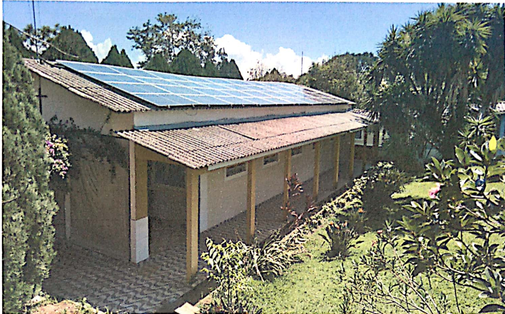
Painéis solares devidamente instalados nos prédios

Fundada em 23/03/1902 Reconhecida de Utilidade Pública pelo Município, Estado e União Instituição de Longa Permanência de Idosos CNPJ: 72.308.588/0001-56