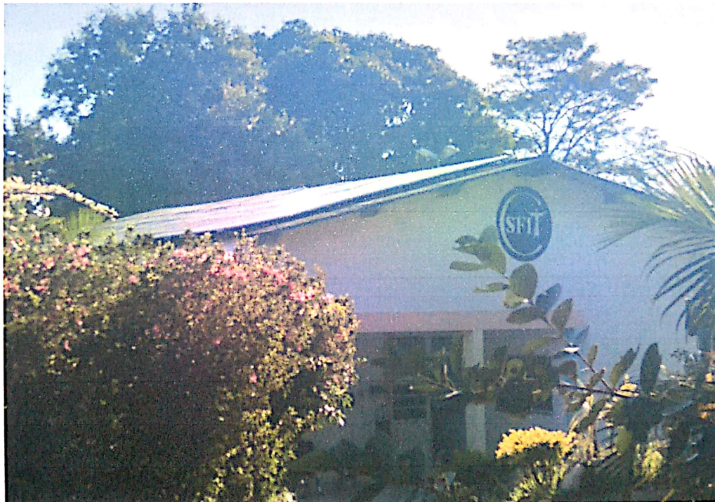
Painéis solares devidamente instalados nos prédios

Rua Maria Basso Monteiro, 391 - Monte Belo - Taubaté/SP www.casasaofrancisco.org.br casasf@ig.com.br (12) 3633-2777/3632-8410