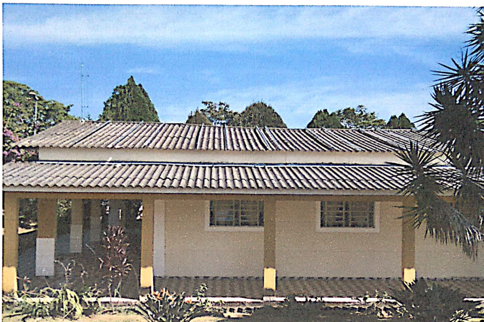
Prédio antes da instalação dos painéis solares