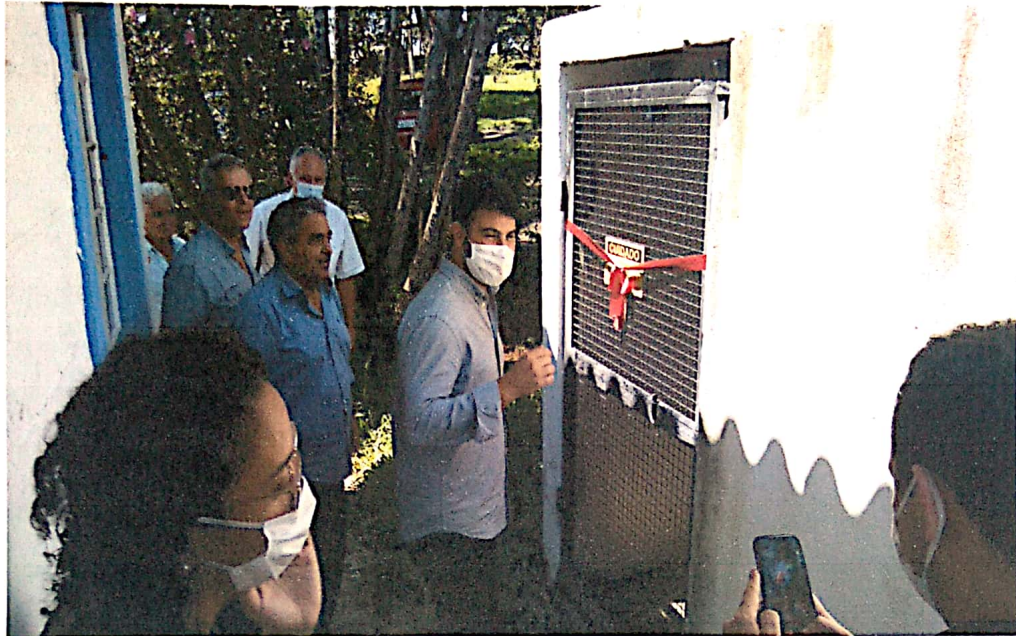
Inauguração e início do funcionamento do sistema de energia fotovoltaica

Fundada em 23/03/1902 Reconhecida de Utilidade Pública pelo Município, Estado e União Instituição de Longa Permanência de Idosos CNPJ: 72.308.588/0001-56